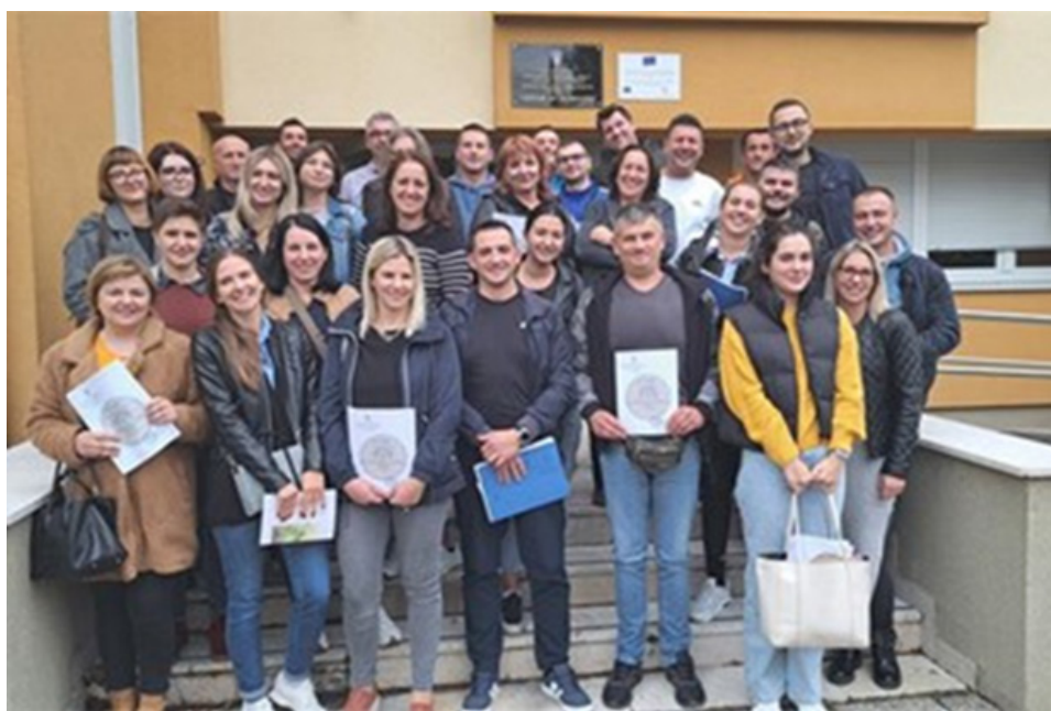
Izobrazba za novozaposlene zatvorske i probacijske službenike

Uz sudjelovanje probacijskih službenika u obveznim programima izobrazbe u organizaciji Centra za izobrazbu, kao što je uvodni program za sve novozaposlene službenike i namještenike pod nazivom „Specifičnosti rada u zatvorskom i probacijskom sustavu te unapređenje suradnje“ (slika 1), probacijski službenici sudjeluju i u specijaliziranim programima izobrazbe koji se odnose na dodatno usavršavanje specifičnog stručnog znanja, vještina i sposobnosti radi povećanja stručnosti i profesionalnosti u radu službenika te učinkovitosti rada u zatvorskom i probacijskom sustavu.